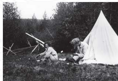
Camping år 1942.