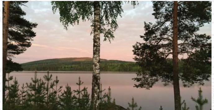
Kerstins udde, Trehörningsjö, 2014.