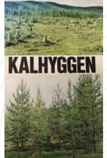
Kalhyggesrapporten DsJo 1974:2

Natur- och landskapsvård, Skogsstyrelsen 1973.