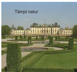
Modernt 1760 och 1914

En samlad naturvårdspolitik, Skr. 2001/02:173: Det är "människan och samhället som måste välja vilken 'natur' vi vill ha i framtiden".