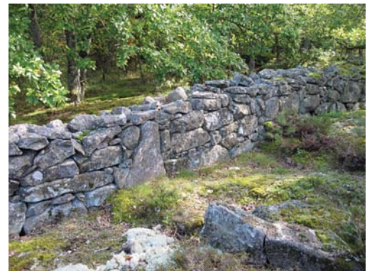
Stenmur i Blekinge