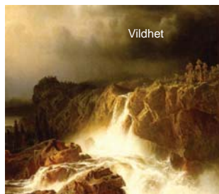
Modernt 1860 och 2014