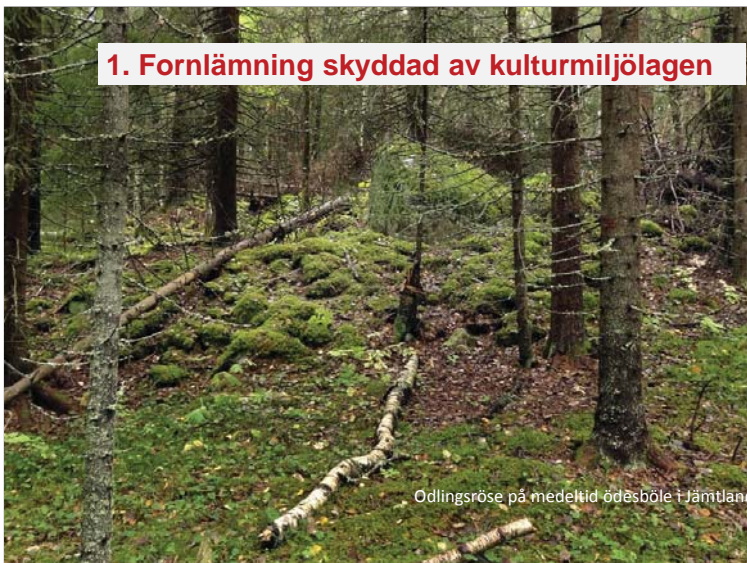
Odlingsröse på medeltid odäsböle i Jämtland